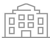
Caja principal UEES.

Las colegiaturas del programa se cancelarán exclusivamente en uno de los siguientes medios: